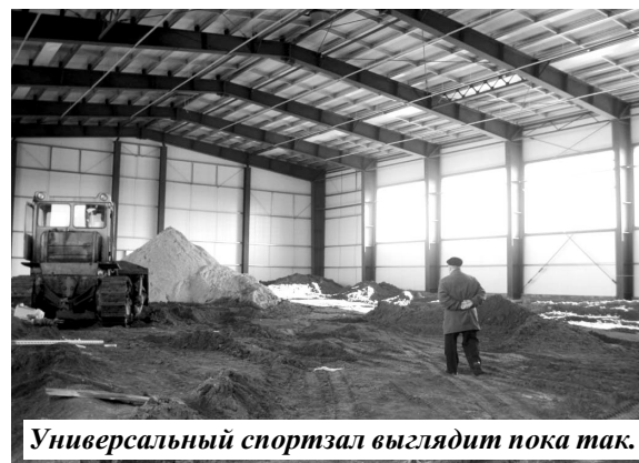
Универсальный спортзал выглядит пока так.

Все вопросы, обсужденные на ней, носили рабочий характер: заработала отопительная система, сле-