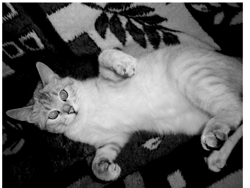
«Ну иди ко мне, шалун!»