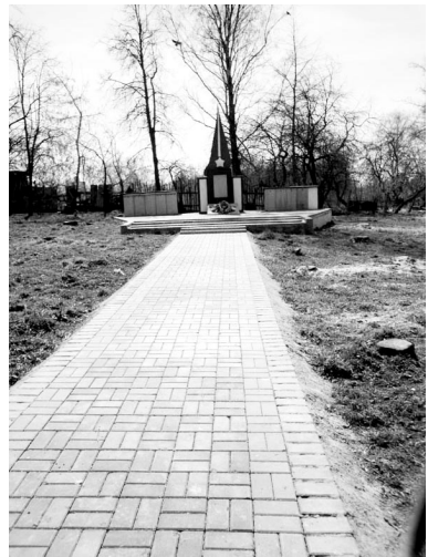
Вот таким увидели памятник сабуровщицы после зимней опилки территории и недавнего субботника по уборке сплениного.

Здесь позволю себе прервать рассказ Розы Юнусовны и сказать вот о чем. Большую роль играет личный пример. Люди обязательно подтягиваются, если на терри-